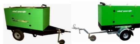
Carrelli di traino lento o veloce Slow or fast towing trailer