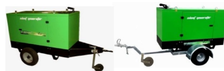
Carrelli di traino lento o veloce Slow or fast towing trailer