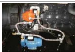
Kit travaso automatico carburante Automatic fuel transfer kit