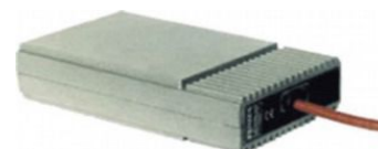
Preriscaldamento Engine preheating system