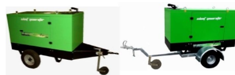
Carrelli di traino lento o veloce Slow or fast towing trailer