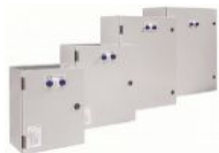
Quadro di commutazione automatica (ATS) da 1000A 1000A automatic transfer switch (ATS)